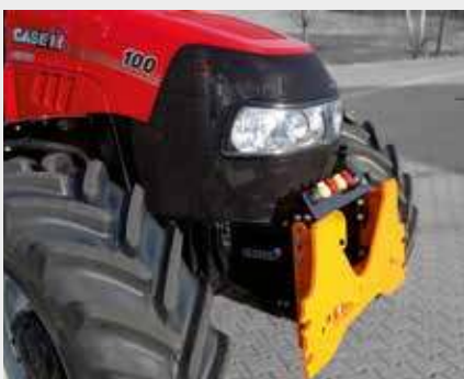
DIN-plaat voor aanbouw aan moederblok