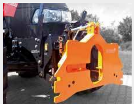
DIN-plaat in fronthef