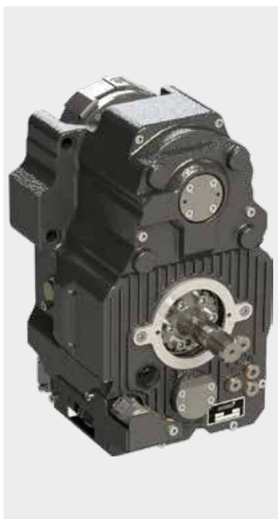
Schakelbare frontaftakas voor nog meer opties