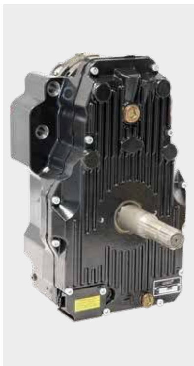
Bekend en bewezen techniek