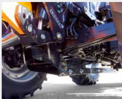
Pushbar voor fronthef