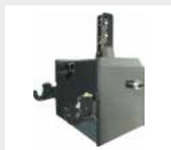
Ballastdrager met vanghaken