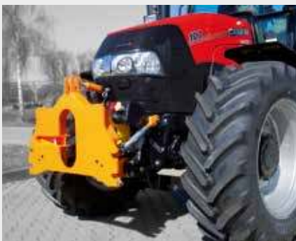
DIN-plaat star gemonteerd aan fronthef

Breidt het gebruiksgemak van de standaard tractor uit en zorgt voor efficiënt en veilig gebruik van materieel.